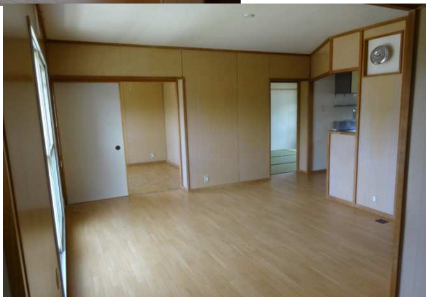
⑦ 台所 (3帖)