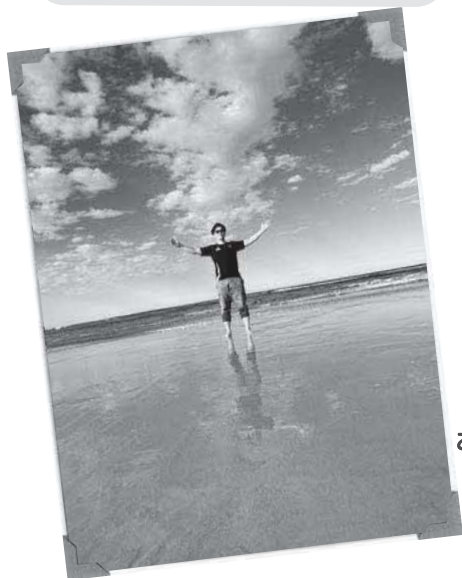
ビーチで撮った お気に入りの写真！