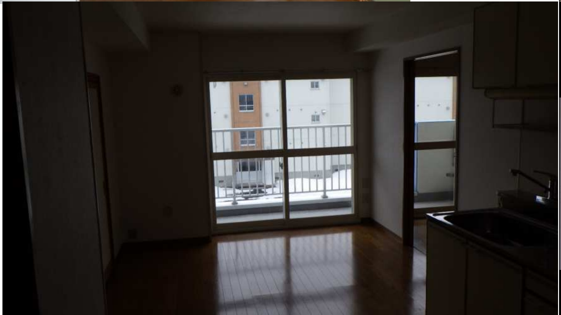
⑦ 台所 (3帖)