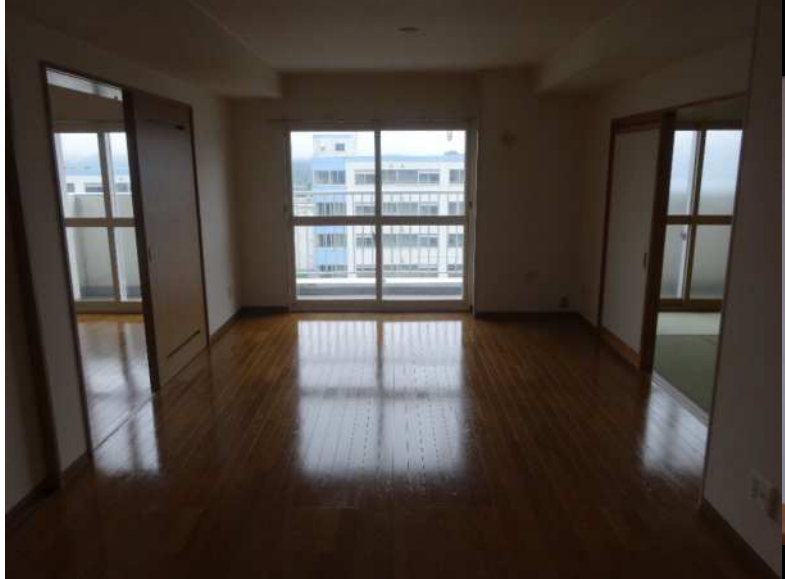
⑦ 台所 (3帖)