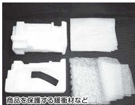
商品を保護する緩衝材など