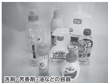
洗剤・芳香剤・油などの容器