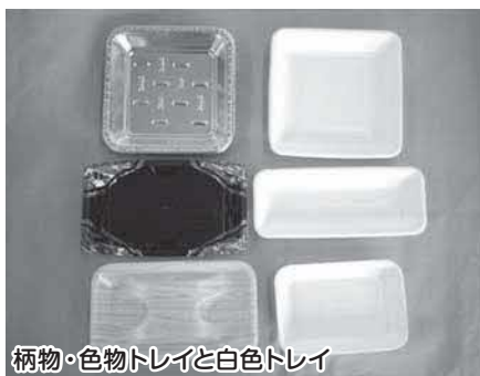
柄物・色物トレイと白色トレイ