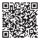
気象庁ホームページ 警報・注意報