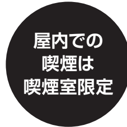
屋内での 喫煙には 喫煙専用室の設置が必要