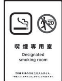
喫煙室には 標識掲示が義務付け