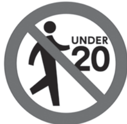
20歳未満は 喫煙エリア立入禁止