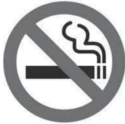
多くの施設において 原則屋内禁煙

昨年7月の病院や学校・行政機関等の敷地内禁煙に引き続き飲食店や事業所などでも、原則屋内禁煙となるほか、20歳未満の方の喫煙エリアへの立入は禁止となります