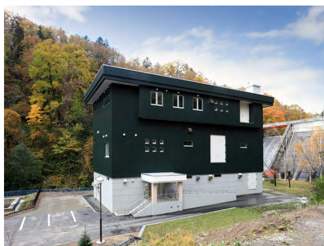
清水沢浄水場 (全景)