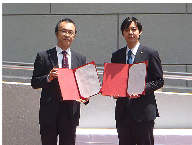
書類の取り交わし (写真左：ゆうばり麗水 (株) 社長)