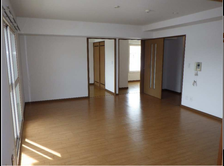
⑥ 居間 (11帖)