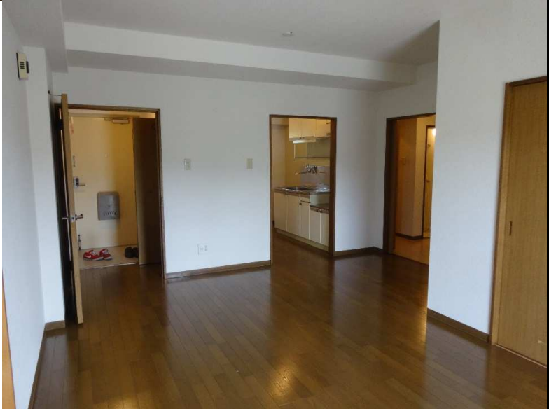
⑦ 台所 (4帖)