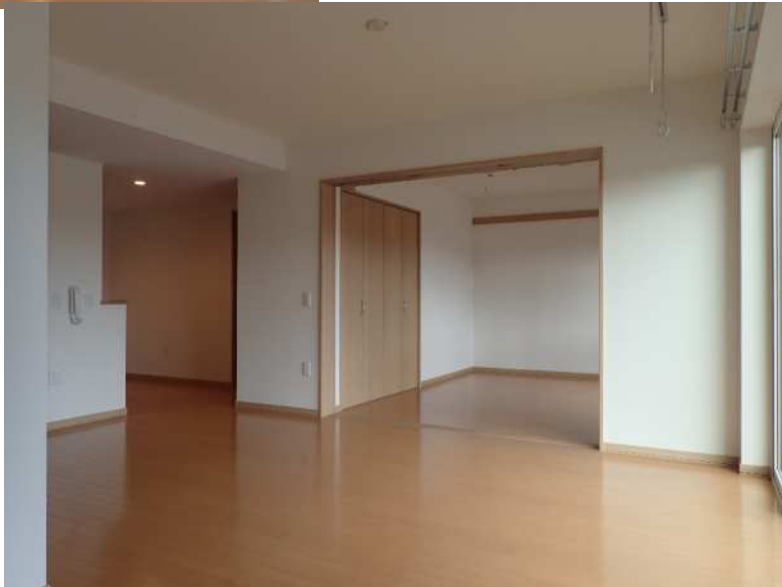
⑥ 台所 (3帖)