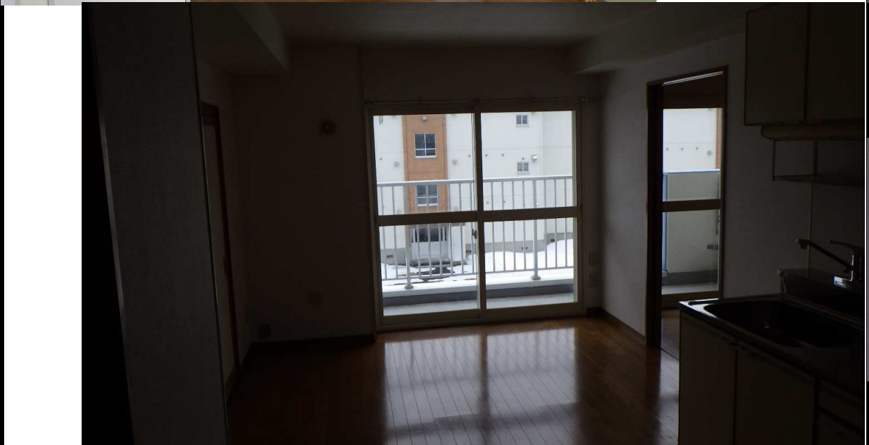
⑦ 台所 (3帖)