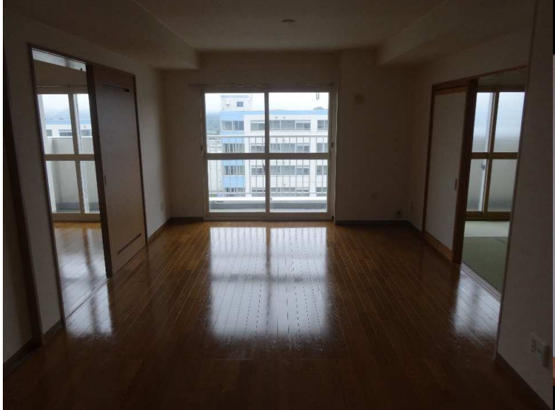
⑦ 台所 (3帖)