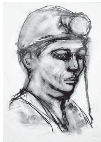
小林 政雄「夕張風物抄」より1点 1999年