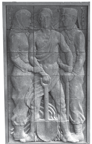
複製されたレプリカ