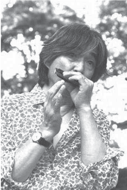
千葉智寿 (ハーモニカ奏者)