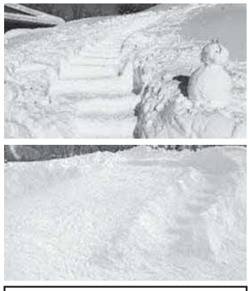
○今回高校生が作成した階段(上)と園児用滑り台(下)

特にワープロ部は今部員が私一人なので、一緒に活動してくれる後輩ができれば嬉しいです!