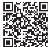
北海道開発局 (道路情報)