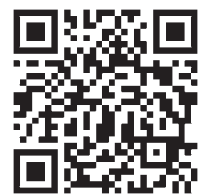
札幌管区気象台 (気象情報)