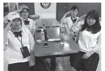
語学研修中に、イオロニ宮殿内にて。艦「ミズーリ」艦内にも訪れることができた。