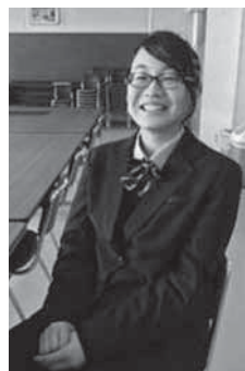
た山崎の話を長回生さん。