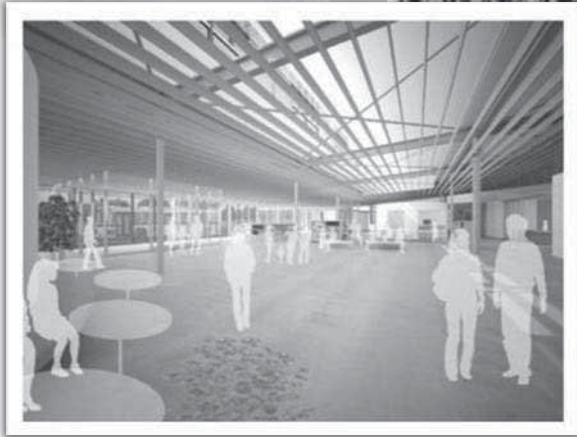
施設内部の様子（8月撮影）