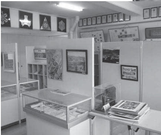
夕張中学校資料室 3階