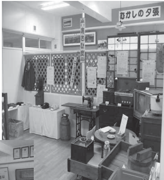
ゆうばり小学校資料室 2階