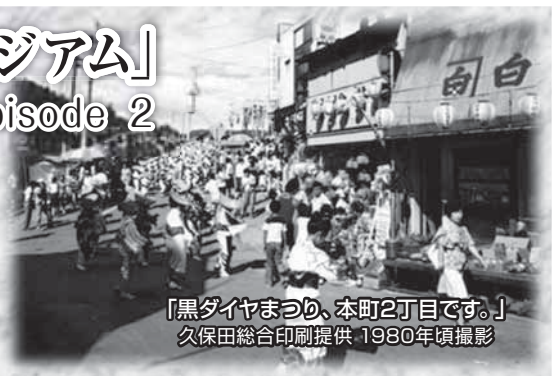
「黒ダイヤまつり、本町2丁目です。」 1980年頃撮影

「みんなでつくる夕張の記憶ミュージアム」 https://yubarinokioku.net/ フェイスブックページ https://www.facebook.com/yubarinokioku/ 夕張の記憶ミュージアム実行委員会 (幹事・清水沢プロジェクト ☎57-7463) (市企画係 ☎52-3141)