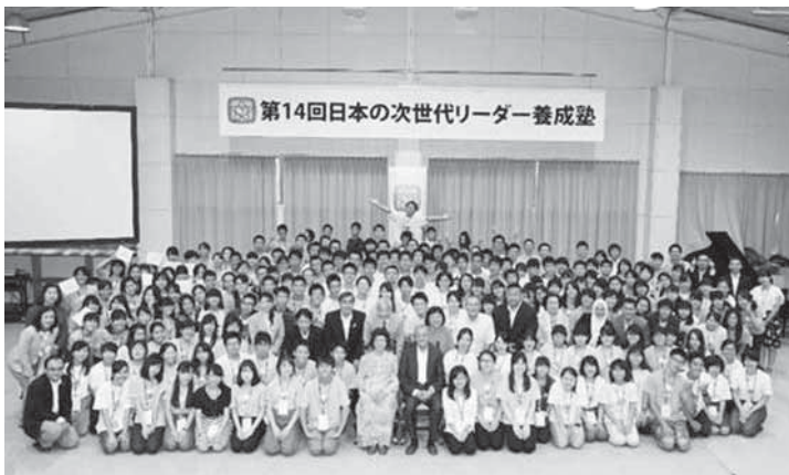
昨年の様子。全国各地から次世代のリーダーを志す高校生が集まり、切磋琢磨した。集団生活や議論の中で、かけがえのない仲間となる。

記者…全国から知らない人が集まってくるのだから、人間としての幅をうんと広げるチャンスだね！