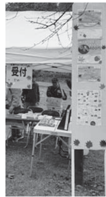
→紅葉ウォーキングの際に設置した受付用のテント前。園内の案内図など必要な情報に加え、二人の特技を活かし、視覚的に楽しめる手作りの装飾にこだわった。

立するデザインを意識しています。世代が違つからこそ生まれる発見やアイデアの共有を欠かさず、共通の趣味であるカフェで、掲載する写真の一枚一枚にもこだわりました。その一例が、昨秋市の公式ホームページにて配信していた『ゆうばり紅葉便2019』でした。