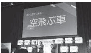
↑東京での発表会、1年生がやり遂げました！

チャレンジ・モア・スピリッツを発揮して挑んだ東京での発表は見事でした。見るたびに成長するみんなを見て感動しました。これからいろいろなことに挑戦してね！