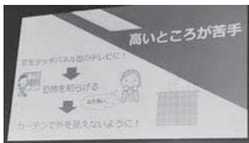
↑カーテンで物理的に外を見えなくする温かいアイデア

⑯ 暗記ができなかったのが悔しいです。他の高校は、劇とか笑いを入れて、わかりやすく説明しててすごいなあって思いました。