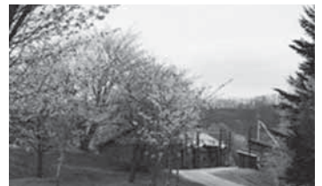
季節:春 場所:幸福の黄色いハンカチ思い出広場 「精神の美」の花言葉を持つ桜が、幸福の集う広場を温かく包み込んでいます。