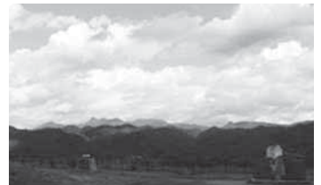
季節:夏 場所:鹿島眺望公園 澄み渡る夏空の下、雄大な自然と共に、静かに流れる時の中で歴史を感じます。