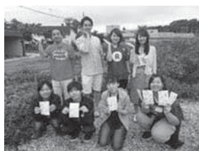
↑楽天の社員さんと夕張の未来を考えました！