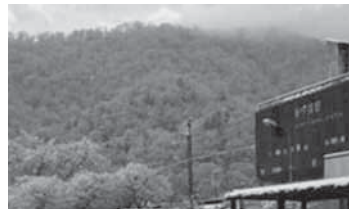
季節:冬 場所:JR新夕張駅 旧紅葉山駅標も残る夕張の鉄路終着地、駅舎と雪のコントラストが美しいです。