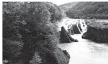
季節:秋 場所:滝の上公園 力強い青葉が徐々に変色し、一瞬で過ぎさる貴重な紅葉期の漂流は圧巻です。

4月号より始まった当連載も、今年度残りあと2回となりました。そこで、今月号は総集編の前編として、移住者の視点から興味深いと感じた夕張市の二面を、ご紹介致します。