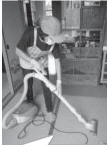
畳にそって ていねいに 掃除機かけ

6月19日(金)から週1回のペースで生活支援サポーターのサービス活動が再び始まりました。依頼があった方の近隣に住むサポーターさんを調整して面談し、ご意向を確認しながらお掃除やゴミ出しなどのお手伝いを行います。サポーターの皆さんは挨拶も声かけもスムーズでテキパキと素晴らしい活躍でした。依頼者の方も「気になっていた所がキレイになって安心しました」とにこやか。今後も支え合える地域をみなさんと共に築いていきます。