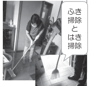
ふき掃除 とはき掃除