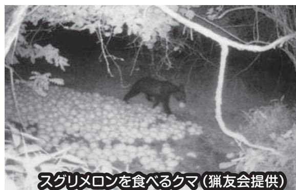
スグリメロンを食べるクマ

クマを誘引する地域の特性として廃棄野菜やぬか漬などの発酵物、油類が考えられますので放置はとても危険です！ クマの嗅覚は、犬の21倍、人間の100倍との報告もあります。秋には栗、桑、ドングリなど木の周辺は注意が必要です。