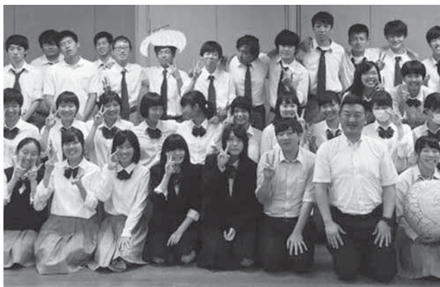
八丈高校の生徒たちと

3名の生徒は、八丈高校留学を通して、知らない人とも積極的に話題をふったり、質問をするなどの「コミュニケーション力」や、何事にも一歩踏み出そうとする「挑戦心」が身についたと述べた。