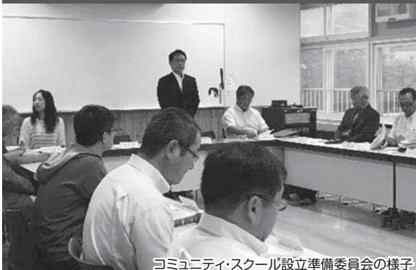
コミュニティ・スクール設立準備委員会の様子

と き 11月17日(金)午後6時30分～ と ころ 清水沢地区公民館 参加は無料で、どなたでも参加できます。