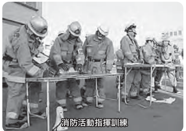
消防活動指揮訓練

財政破綻後、経験や知識の豊富な先輩たちが退職し、災害現場での指揮活動、安全管理などの研修に参加する機会がなく、今回の研修は忘れることのできない貴重な体験となりました。