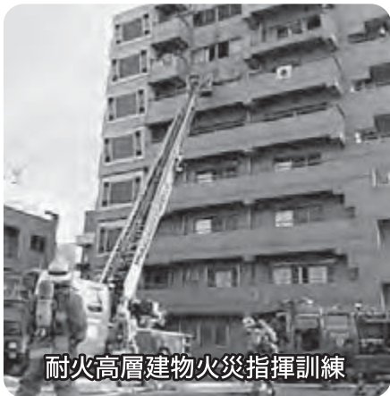
耐火高層建物火災指揮訓練