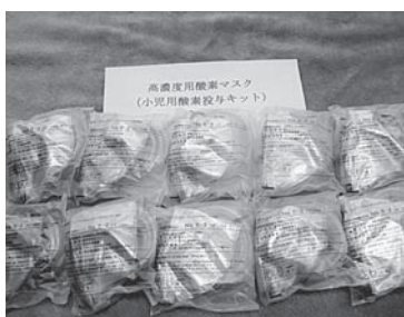
高濃度用酸素マスク (小児用酸素投与キット)