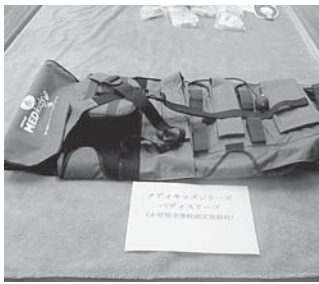
メディキッズ677ペディスリーブ (小児用全脊柱固定資器材)