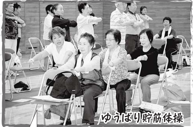
ゆうばり貯筋体操

文化スポーツセンター(7月5日)と市民健康会館(7月12日)で、ゆうばり貯筋体操が行われました。2日間で53歳から86歳の延べ96人が参加し、楽しみながら体操に取り組みました。