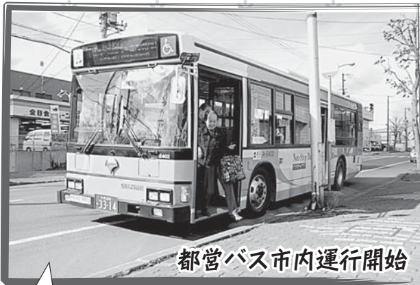
都営バス市内運行開始

11月1日、東京都から無償で譲り受けた都営バスの運行が始まりました。外装は黄色と緑の都営バスカラーのままで、乗降口に段差がないノンステップタイプ。利用客には「乗り降りがしやすい」と喜ばれています。