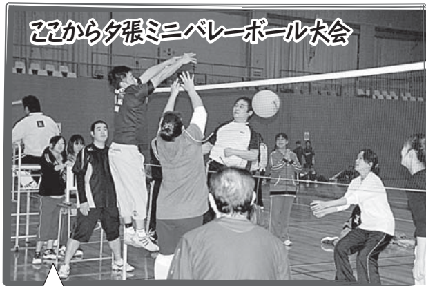
ここから夕張ミニバレーボール大会

11月9日、ゆうばり小学校で「昔遊び体験」が行われました。1年生の児童38人が参加し、ボランティアの皆さんに遊び方を教えてもらいながら、けん玉、メンコ、お手玉、おはじき、あやとりなどを体験しました。