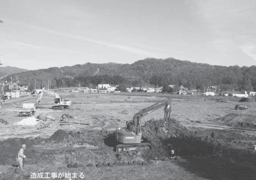
造成工事が始まる