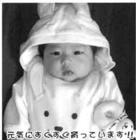
元気にあぐらをかいています!!