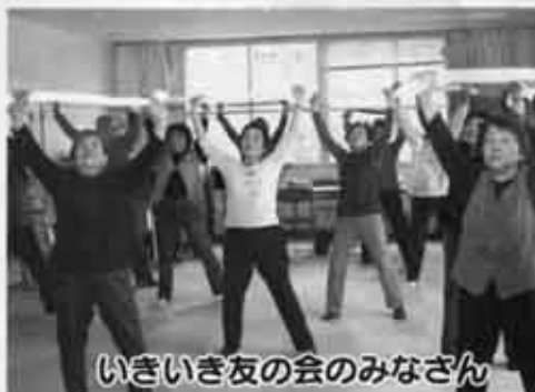
いきいき友の会のみなさん

この5月から、広報の中で「そよ風通信」をお届けします。身近な健康情報を市の保健師、栄養士が交替で提供します。今号は、地域で介護予防活動を自主的に実践している2団体を紹介します。