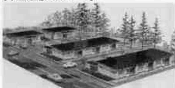
【平屋住宅のイメージ】