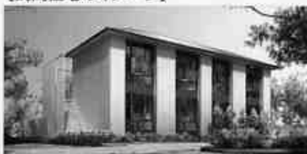
【民間住宅のイメージ】