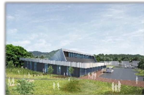
夕張市拠点複合施設