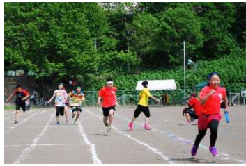
《白熱の高学年リレー》