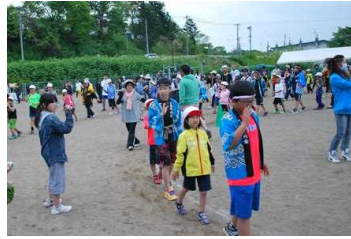
《阿呆踊り・黒ダイヤ囃子》