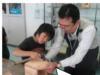
金槌で釘を打つのに悪戦苦闘。でも出来上がりに笑顔

今月は3年生の「バードハウス作り」や4年生の「環境学習」等、外部講師を招いての授業がありました。普段とは違う先生方と少し緊張しながらも楽しく体験学習をしました。