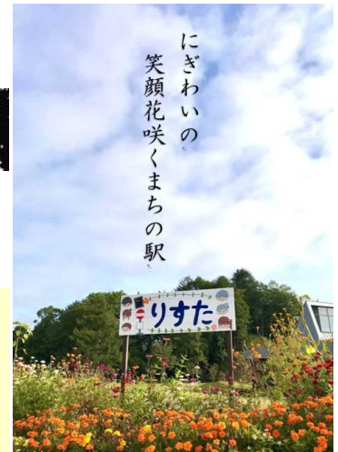
美術部の皆さんが作った「りすた」の看板が輝いています

私たちは人の形をした「星(ひかり)」です。一人一人が異なる光を放ち、輝き、夕中の星座を形づくっているのです。どうしようもない孤独に襲われたとき、困難に陥ったとき、誰かの「星(ひかり)」の存在が救いになることがあります。そして自分の「星(ひかり)」が誰かを救っていることがあります。目には見えない絆が、ひとつひとつの星々を結びつけ、星座をつくりあげています。