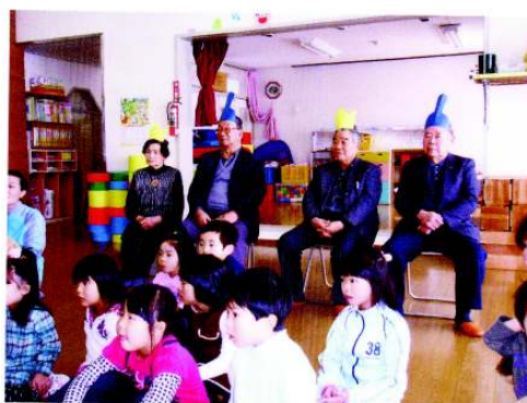
＜夕老連ふれあい交流会＞