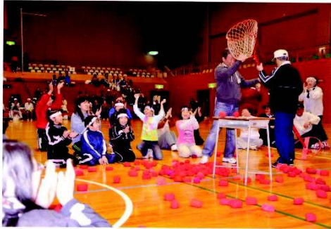
<夕老連世代間スポーツ交流会>