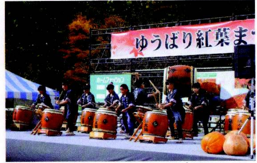
<ゆうばり紅葉まつり>