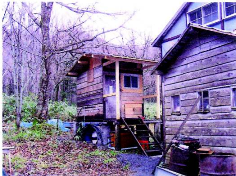
<夕張岳ヒュッテ補修事業>