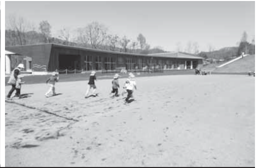
令和3年4月 ゆうばり丘の上こども園開園