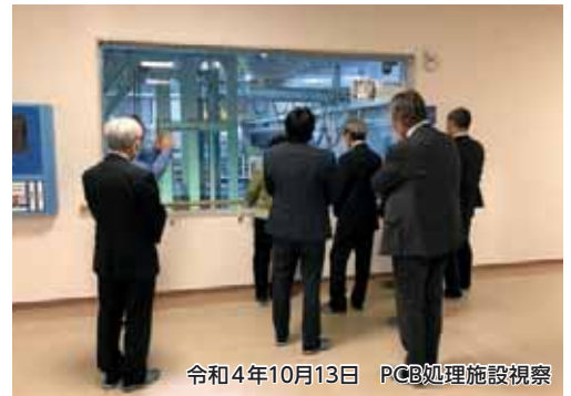
令和4年10月13日 PCB処理施設視察