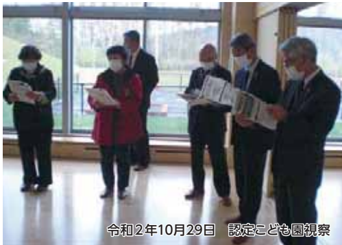
令和2年10月29日 認定こども園視察