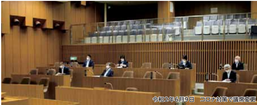
令和2年6月9日 コロナ対策で議席変更