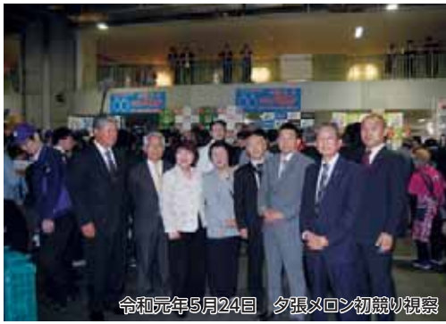
令和元年5月24日 夕張メロン初競り視察