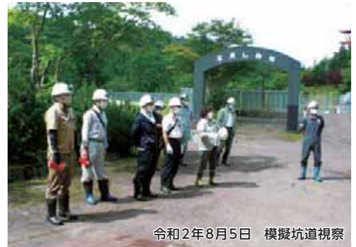
令和2年8月5日 模擬坑道視察