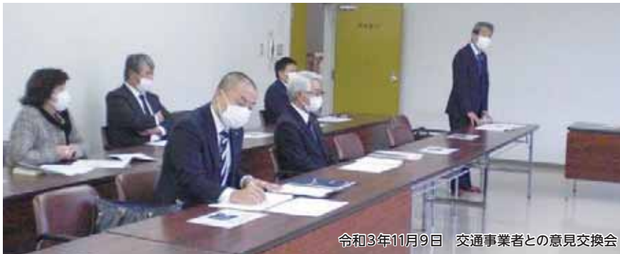
令和3年11月9日 交通事業者との意見交換会