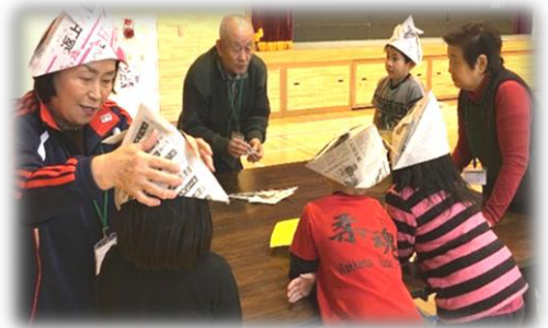
学校支援ボランティアの活動の様子

地域全体で教育活動を支えていく体制に、より一層、みなさんのご協力をお願いします。