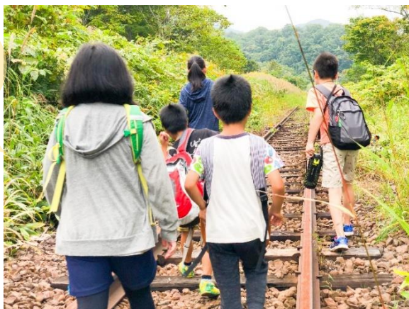
夕張支線廃線後、線路の上を歩くイベントの様子