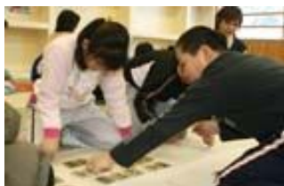
子どもからた推進事業の様子