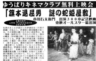
ゆうばりキネマクラブ特別上映会のチラシ