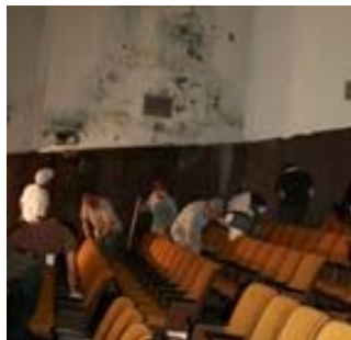
市民会館の再開に向けた調査事業の様子

事業名『夕張観光・産業・食イメージアップ事業』は、助成決定後、助成の辞退をしております。