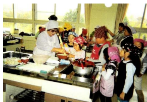
健康料理普及活動の様子