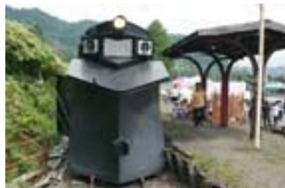
保存車両、屋根補修事業の様子