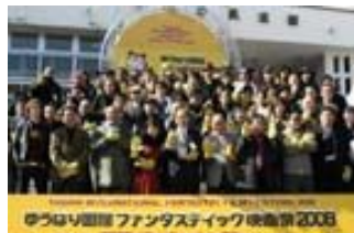
ゆうばり国際ファンタスティック映画祭2008の様子