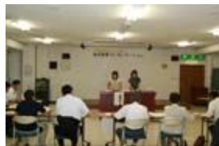
公開プレゼンテーションの様子(19.8.26開催)

申請された事業の審査を行なうため、公開プレゼンテーションを平成19年8月28日に開催し事業の審査を行なったうえで、20事業に対する助成の決定を行ない、最終的に19事業へ助成を行ないました。