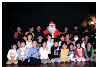
クリスマス会の様子