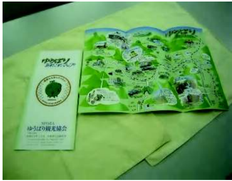
※ゆうばりあれこれマップ