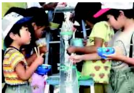
※子育て支援事業の様子