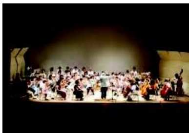
※ゆうばりメロンオーケストラ