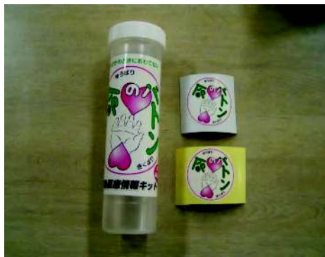
※救急医療情報キット『命のバトン』