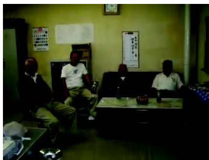
※沼ノ沢・真谷地地区ふれあいサロンの様子