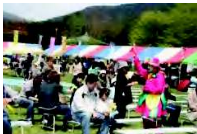
※ゆうばり桜まつり