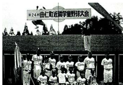
<野球少年団推進事業(清水沢ライオンズ)>