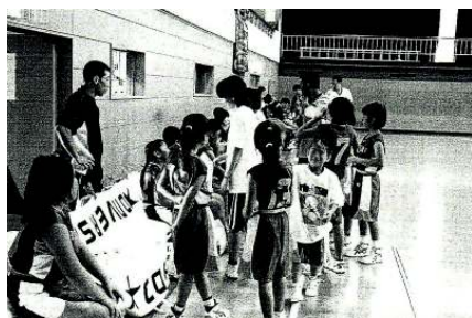
<ミニバスケットボール交流事業>