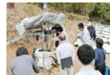
新たな担い手への指導