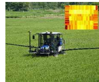
生育センサー付き 可変施肥機