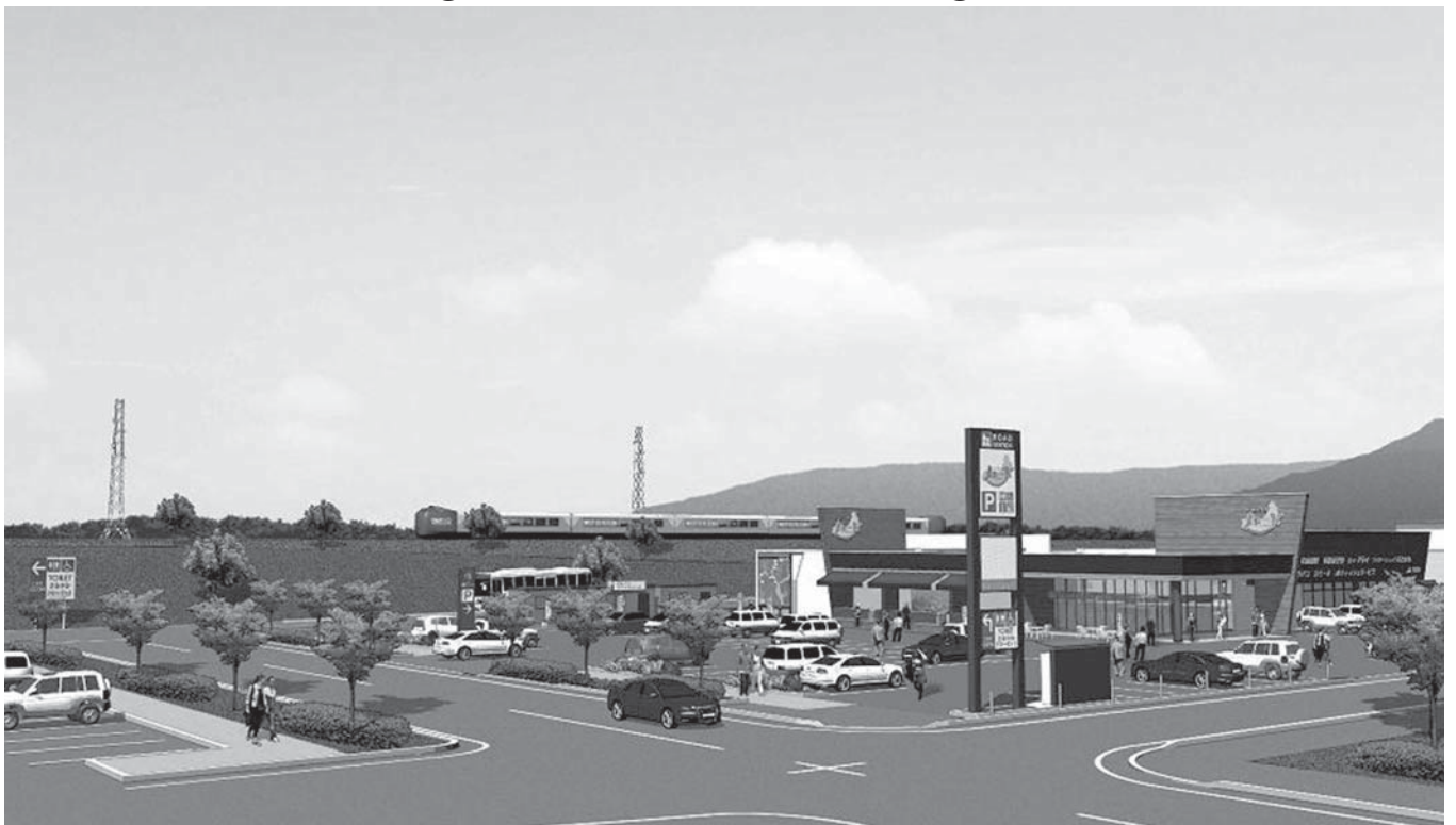
道の駅「夕張メロード」オープン後のイメージ