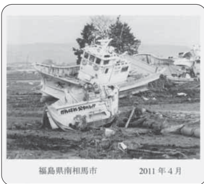
福島県南相馬市 2011年4月

石狩市在住のカメラマン田中正秋氏が見た被災地福島県の写真展です。 とき・ところ 9月16日～29日 ふるさとギャラリー「あずまし」市庁舎2階、10月3～14日 南支所 庁舎開庁時間・土日休み 問合せ先 市教育課 ☎52-3166