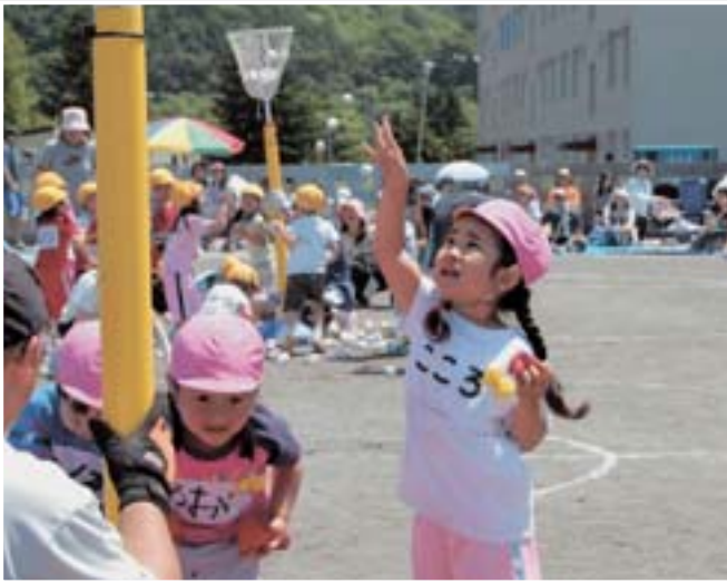
6月17日 ユーパ口幼稚園運動会